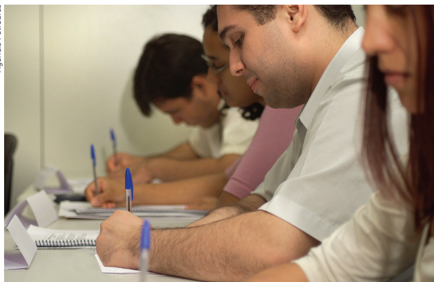
Colaboradores da Petrobras em treinamento na empresa: parceria com o SENAI