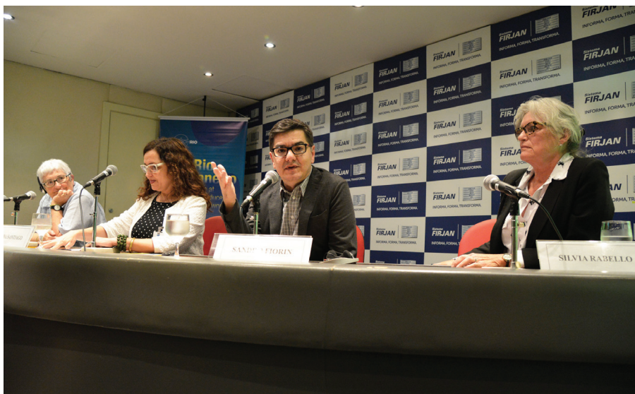
No seminário, foram debatidas as formas de inserção internacional do audiovisual brasileiro