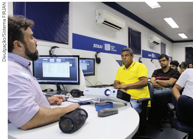
Aula no laboratório móvel do SENAI na cidade de Três Rios

que atuam no setor da Construção Civil com o que há de mais moderno em modelagem computacional. São ofertados cursos de curta duração em Revit.