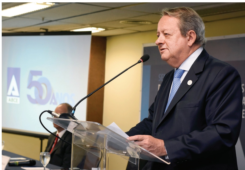
Guarim de Lorena

Também trazem possibilidades para a expansão da infraestrutura os planos para integração do sistema