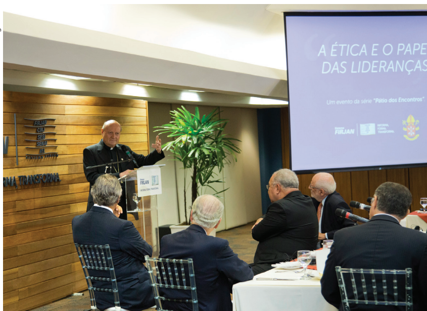
Para o cardeal Gianfranco Ravasi, a falta de ética possibilita o avanço da corrupção