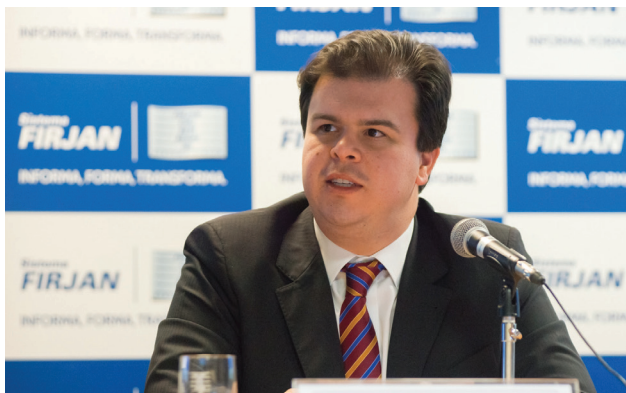
O ministro Fernando Coelho Filho: perspectivas do setor elétrico